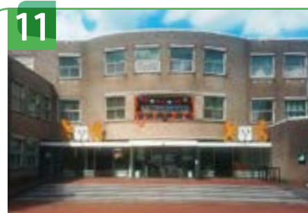
11 GEMEENTEHUIS BURG. VAN DER WILLIGENSTRAAT

Dit is het gemeentehuis van de voormalige gemeente Nederlek. Het pand is gebouwd in 1989/1990. Momenteel is het dependance van de gemeente Krimpenerwaard met onder meer de raadszaal. Op de parkeerplaats aan de achterzijde van het pand staat aan de rechterkant een herinneringsmonument van de achttien doden. De jongste daarvan was Lekkerkerker