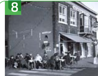
8 VOORMALIGE HERBERG DE GROOTE BOER VOORSTRAAT 118

Op de kruising van de Burg. van der Willigenstraat en Emmastraat staat het woonhuis dat nog overgebleven is van een voormalige touwslagerij. Hier werden destijds touwen verwerkt en gemaakt. De machines en gereedschappen zijn ondergebracht in het Streekmuseum Krimpenerwaard in Krimpen a/d IJssel.