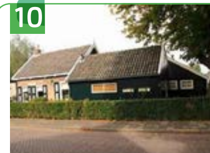
10 VOORMALIGE TOUWSLAGERIJ EMMASTRAAT 1

Het pand aan Voorstraat 66 was vroeger een leerlooierij. Aan de gevel hing een stenen ossenkop die later is verplaatst naar het kantoorpand van de voormalige firma Luijten. De stenen ossenkop is diverse malen gerestaureerd, totdat dit niet meer mogelijk was. De replica is gemaakt van kunststof en deze is op Open Monumentendag te zien.