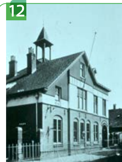
12 SCHOOLWEG 5 EN 4 ACHTERSTRAAT 9

Op de plaats waar nu restaurant Golden River is, was vroeger herberg De Grootte Boer. Het pand is gebouwd in 1887 ter vervanging van de eeuwenoude herberg. De naam van de herberg is afkomstig van Gerrit Bastiaanszn. de Hals die leefde van 1620 tot 1668. Vanwege zijn lengte, ruim twee meter, werd hij 'de Grootte Boer' genoemd. Hij was destijds een vaste bezoeker van de herberg. Gerrit raakte op de kermis betrokken bij een vechtpartij en werd dodelijk gewond.