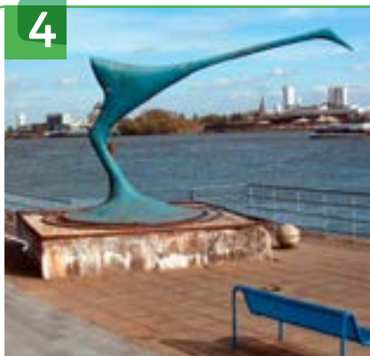
4 VOORMALIGE FIRMA LUIJTEN VOORSTRAAT

Bij de hoofdingang van de Breeje Hendrick staat het beeld Phyllotaxis dat is gemaakt door Sjoerd Buisman. De phyllotaxis betekent bij planten de rangschikking van bladeren ten opzichte van elkaar langs de stengel van de plant. Hierin zijn verschillende soorten te onderscheiden. De phyllotaxis is een inspiratiebron voor Buisman. Vanaf de jaren '80 maakt hij phyllotaxisbeelden die op meerdere plaatsen in Nederland te bewonderen zijn.