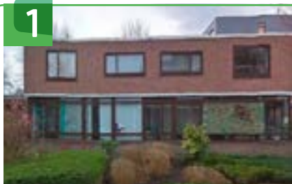
1 OUDHEIDSKAMER 'T KRUISGEBOUW POOLMANWEG 11

In dit pand uit 1963 is op de bovenverdieping de Oudheidskamer van Historische Vereniging Lekkerkerk door de tijd gevestigd. Deze vereniging probeert de geschiedenis van het dorp levend te houden. Kijk voor meer informatie op www.lekkerkerkdoordetijd.nl . In 't Kruisgebouw heeft ook Stichting Archeologie Krimpenerwaard haar onderkomen. Vroeger diende dit gebouw als Groene Kruisgebouw, maar het is nu in beheer van Stichting Kruiswerk Lekkerkerk.