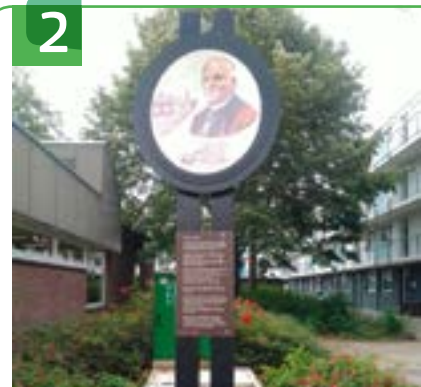
2 BIBLIOTHEEK EN SCHILDERIJ BREEJE HENDRICK TALMASTRAAT 1

In dit pand uit 1963 is op de bovenverdieping de Oudheidskamer van Historische Vereniging Lekkerkerk door de tijd gevestigd. Deze vereniging probeert de geschiedenis van het dorp levend te houden. Kijk voor meer informatie op www.lekkerkerkdoordetijd.nl . In 't Kruisgebouw heeft ook Stichting Archeologie Krimpenerwaard haar onderkomen. Vroeger diende dit gebouw als Groene Kruisgebouw, maar het is nu in beheer van Stichting Kruiswerk Lekkerkerk.