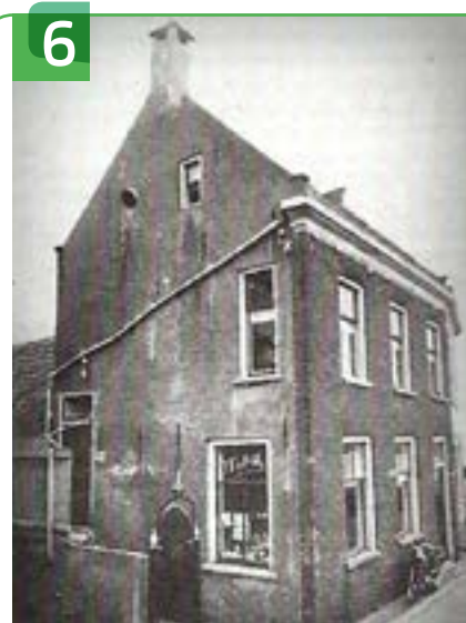
6 VOORMALIGE SYNAGOGES VOORSTRAAT 150

Op Voorstraat 17 staat een rijksmonument uit 1870. Het huis is gebouwd in opdracht van de heer Kersbergen, directeur van een zalmvisserij. Hij liet hier het woonhuis met inpandig kantoor bouwen. Een opvallend element is de vloedstoep, die geplaatst is vanwege de kans op hoog water. Dit past dan ook bij een dijkhuis. Bijzonder zijn ook de Oegstgeester dakpannen, die in de tweede helft van de 19e eeuw in Oegstgeest zijn geproduceerd. De woning is gebouwd in eclectische trant en dit blijkt onder meer uit de symmetrisch ingedeelde lijstgevel.