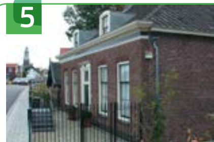
5 DIRECTEURSWONING VOORSTRAAT 17

Op deze plaats is een recreatieterrein langs de Lek. Hier staan twee polyester kunstwerken, namelijk een anker en een kraanvogel. De kraanvogel staat op een onderstel van een oude kraan. Op de plaats van het relatief nieuwe woningbouwcomplex was vroeger de bouwmaterialenhandel van de firma M. Luijten gevestigd. Dit bedrijf is onder de naam als Van Neerbos Bouwmaterialen in 1979 verplaatst naar Haastrecht.