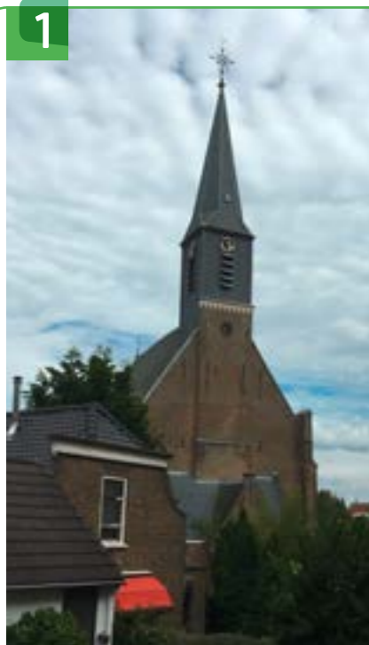
NEDERLANDS HERVORMDE KERK KERKSTRAAT 3