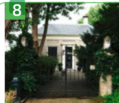
STEENBAKKERSWONING DORPSSTRAAT 45

De woning aan Dorpsstraat 45 is een rijksmonument. Het was oorspronkelijk een steenbakkerswoning en daarna een burgemeesterswoning. Later is het bewoond door een kolonboer en meerdere huishoudens. Het pand is vermoedelijk gebouwd in het tweede kwart van de 19e eeuw voor de steenbakkersfamilie Smits en is in neoclassicistische stijl gebouwd. Het grote huis heeft gedeeltelijk bepleisterde muren, een schilddak met hoekschoorstenen en een kroonlijst. Ook is er een geblokte deuroplijsting en zijn er liggende nissen boven de van zesruitschuiframen voorziene vensters.