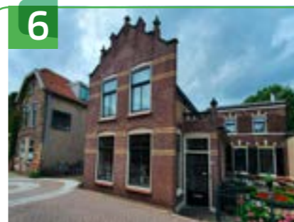
WOONHUIS EN BEDRIJFSRUIMTE DORPSSTRAAT 39

Dit pand aan Dorpsstraat 52 is het voormalige raadhuis. Het is gebouwd in 1842 en het is opgetrokken in neoclassicistische stijl. De muren zijn gepleisterd en het pand bestaat uit een begane grond en een verdieping. De voorgevel is voorzien van zes- en vierruitsschuiframen die zijn afgedekt met een kroonlijst. De gevel wordt afgesloten met een fronton, waarin het wapen van Gouderak is opgenomen.