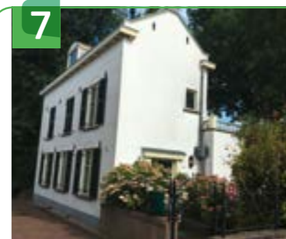
VEERHUIS VEERSTRAAT 5

een nieuwe openbare basisschool op en deed ze een aanbesteding voor de bouw van de school met onderwijzerswoning. De voormalige onderwijzerswoning is een gaaf bewaard eclectisch pand dat versierd is met ornamenten, zoals gepleisterde vensterbogen en een meanderende waterlijst. Het pand bestaat uit twee bouwlagen onder een laag zadeldak, waarvan de nok haaks op de straat staat. De gevels zijn gemetseld in ijsselstenen in staand verband. De voorgevel heeft op de begane grond een deur met aan weerszijden een hoog venster en op de eerste verdieping zijn twee vensters. Diverse elementen zijn vernieuwd, want oorspronkelijk waren er zesruits T-ramen en een dubbele voordeur. Boven de segmentboog van de voordeur is een gepleisterd palmet aangebracht. Ook boven de nis van de bel is ter versiering een dergelijk gestileerd palmet aangebracht. Deze bel luidde men iets voordat de school begon.