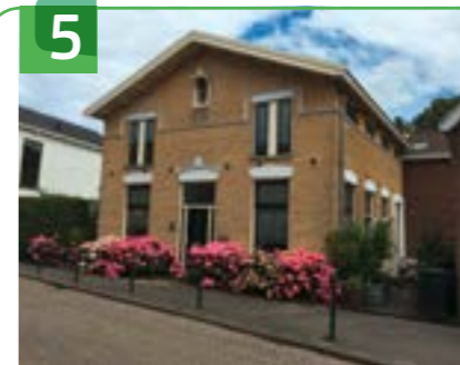
ONDERWIJZERSWONING EN POSTKANTOOR DORPSSTRAAT 48

Dit woonhuis met voormalige bedrijfsruimte uit 1901 is een gaaf bewaard voorbeeld van een woon- en bedrijfspand in traditionele architectuur met eclectische stijlkenmerken. Dit blijkt uit de bekroning van de gevel, tegels in de boogvelden boven de kozijnen, topilasters en de aanzet- en sluitstenen. De ijsselstenen in de zijgevels zijn karakteristiek voor de Krimpenerwaard. Het gedeelte van het pand aan de zuidzijde is opgetrokken in rode baksteen en gele ijsselsteen in één bouwlaag onder een mansardedak. Het dak is voorzien van zwart gesmoorde kruispannen. De voorgevel is uitgewerkt als een puntgevel met schouders en rijke bekroning in de vorm van verschillende soorten pinakels en een toppilaster. In de topgevel is een dichtgemetselde keperboog aanwezig. Aan de noordzijde is een aanbouw met daarin de voordeur. De zuidgevel heeft twee houten openslaande deuren en houten kozijnen met persiënes, een soort raamluiken. In de boogvelden boven de vensters zijn keramische tegels met een motief aangebracht.