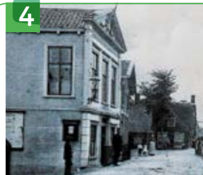
VOORMALIG RAADHUIS DORPSSTRAAT 52

De Graanmaalderij of de voormalige coöperatie Ons Voordeel is gebouwd in 1916 door een coöperatie van boeren uit Gouderak. Architect P. van den Broek uit Zevenhuizen ontwierp het gebouw. Het pand bestaat uit twee bouwlagen - een kelder en begane grond - en een kapverdieping. In het begin van de 20e eeuw zijn in veel dorpen in de regio landbouwcoöperaties opgericht. Ondanks het feit dat veel gebouwen hun functie hebben verloren, zijn ze nog steeds herkenbaar. Deze Graanmaalderij ligt aan de Hollandse IJssel, zodat schepen met graan tegen het gebouw konden afmeren en rechtstreeks konden lossen zonder vervoer over de weg. Eind jaren '50, begin jaren '60 is de coöperatie gestopt en verloor de Graanmaalderij zijn functie. Hierna vestigde een meubelmaker zich in het pand, maar daarna stond het jaren leeg. In 2011 kochten Karel en Esther van Berk het pand en renoveerden het met behoud van details en authentieke sfeer en met gebruik van bestaand materiaal. De begane grond is te huur voor kleinschalige zakelijke activiteiten.