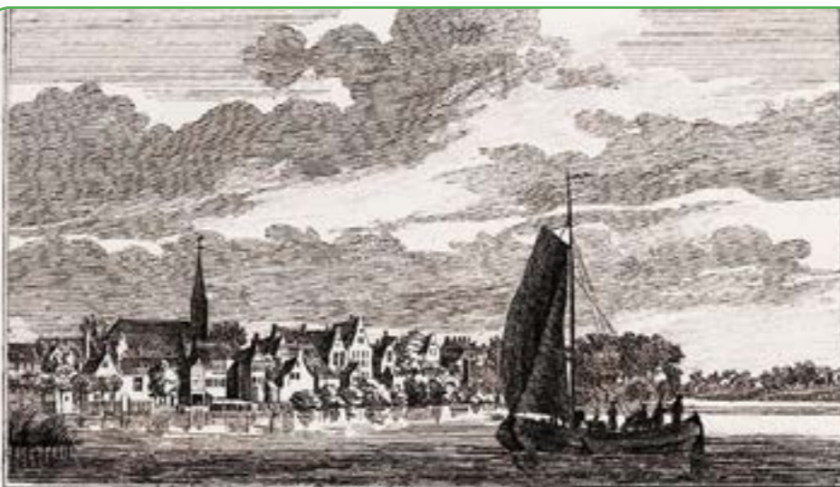
't Dorp Gouderak aan den Ysel.

Het pand is door zijn architectonische vormgeving met een ingezwenkte lijstgevel en baksteenarchitectuur een, inmiddels zeldzamer, voorbeeld van traditionele dorpsbebouwing uit het midden van de 19e eeuw. De gevel en forse kroonlijst zijn kenmerken van de destijds populaire neoclassicistische bouwstijl. Dit huis is een typische dijkwoning. Het bestaat aan de voorgevelzijde (dijkzijde) uit één bouwlaag en aan de achtergevelzijde uit twee bouwlagen. Verder heeft het pand een zolder onder een mansardedak (gebroken kap) waarvan de nok haaks op de weg staat. Het dak is bedekt met oranje oud-Hollandse pannen. Vermoedelijk is de kapconstructie oorspronkelijk. De voorgevel met ingezwenkte lijstgevel is gemetseld met lokale gele ijsselstenen in kruisverband. Rollagen in donkerkleurige bakstenen sluiten de inzweningen af en aan de uiteinden van deze rollagen zijn twee gevelstenen met daarop 'ANNO' en '1846' aangegeven. De achtergevel op de eerste verdieping is later gewijzigd.